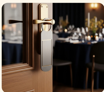
完全プライベート空間 (貸切)

チームの皆様が気兼ねなくリラックスし、つながりを深められるプライベートな空間をご用意します