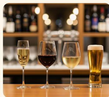
飲み放題 パッケージ

交流を促すダイナミックなスタンディングビューフェ、またはフォーマルなお祝いにぴったりのエレガントな着席コースメニューからお選びいただけます